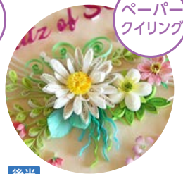
ペーパークイリング